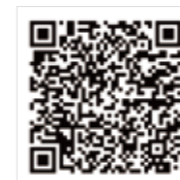
市长设计奖 官方QQ联络群