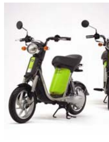
雅马哈 PASSOL 电动小型摩托车