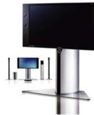
三星电子 SV50L7 系列 DLP 背投电视