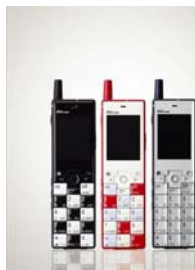
KDDI INFOBAR 流动电话