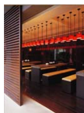
湖南白沙源 白沙源茶馆