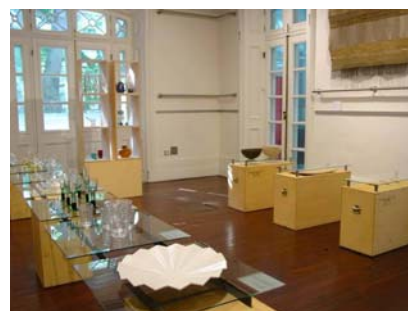
「芬兰设计一二五周年展」 讲座及展览 二零零四年三月五至廿一日