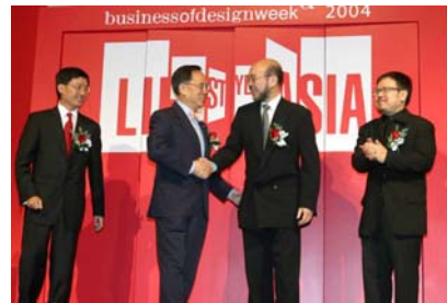
「设计营商周」二零零四： 亚洲风尚 - 开幕典礼 二零零四年十一月十八日