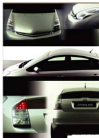
丰田汽车 Prius 混合动力房车