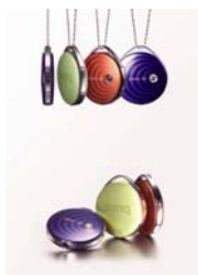
明基 Joybee 102 音乐随身听