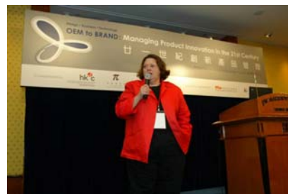
「廿一世纪创新产品管 理」研讨会 二零零四年六月四日