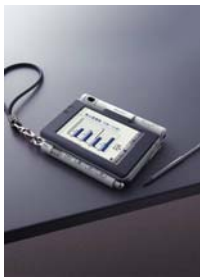
索尼 CLIÉ PEG-UX50 个人数码助理