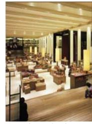
诚品书店 高雄大远百店