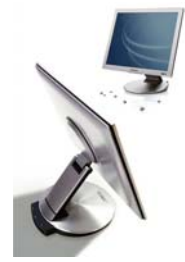
三星电子 SyncMaster 173P 液晶显示屏