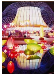
思联建筑设计 彩灯大观园