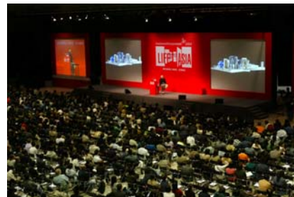
「设计营商周」二零零四： 亚洲风尚 - 闭幕点题讲 者：费兰克·盖里 二零零四年十一月十八日