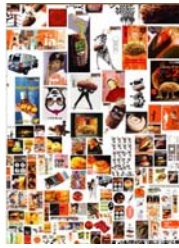
面包物语 全方位品牌策略