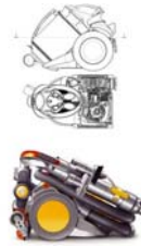
Dyson DC12 吸尘器