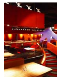
大快活 变身·大快活