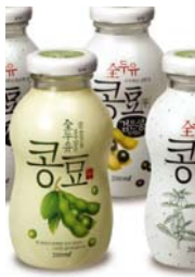
韩美全豆乳 KONG-DOO 品牌及 包装策略