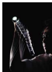
Daka 多功能手摇充电式电筒