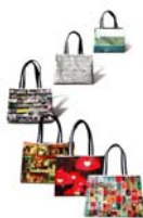
住好啲 香港「街头剪影」手提袋